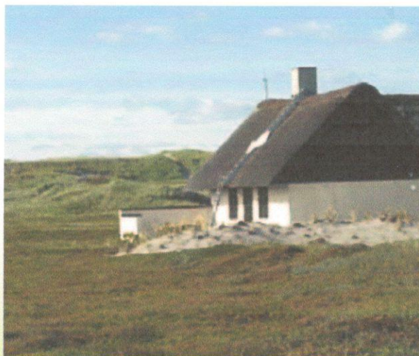
^ Nyanlagt vold beplantet med marehalm

^ Vold anlægges i forlængelse af opholdsarealerne og beplantes med hjemmehørende arter eksempelvis hjælme, marehalm eller lyng.